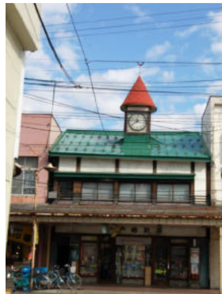
街中に残る時計台 (一戸時計店)