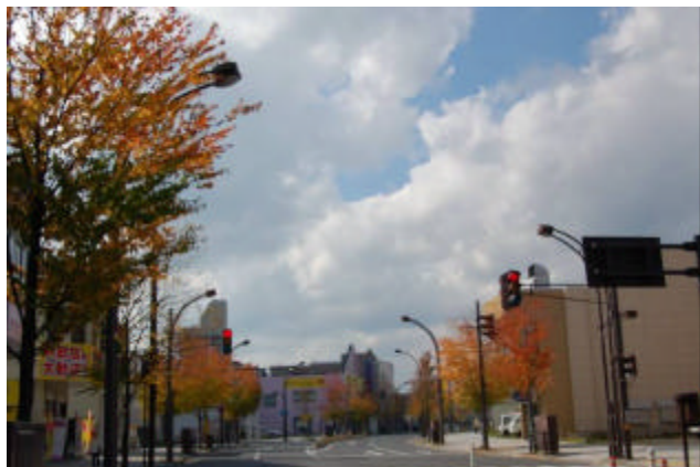
桂の街路樹が美しい弘前市内