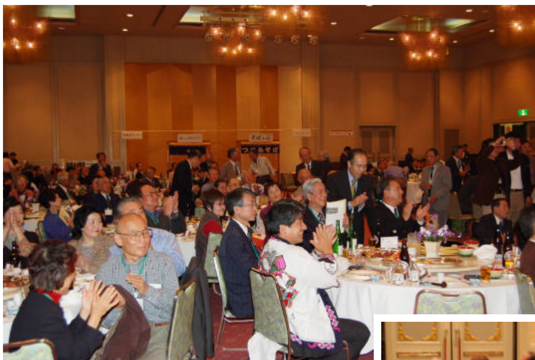
祝賀会場 ホテルニューキャッスル