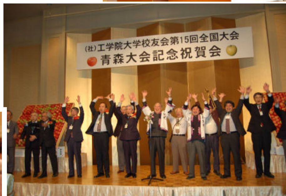
青森支部の皆様ご苦労さんでした。