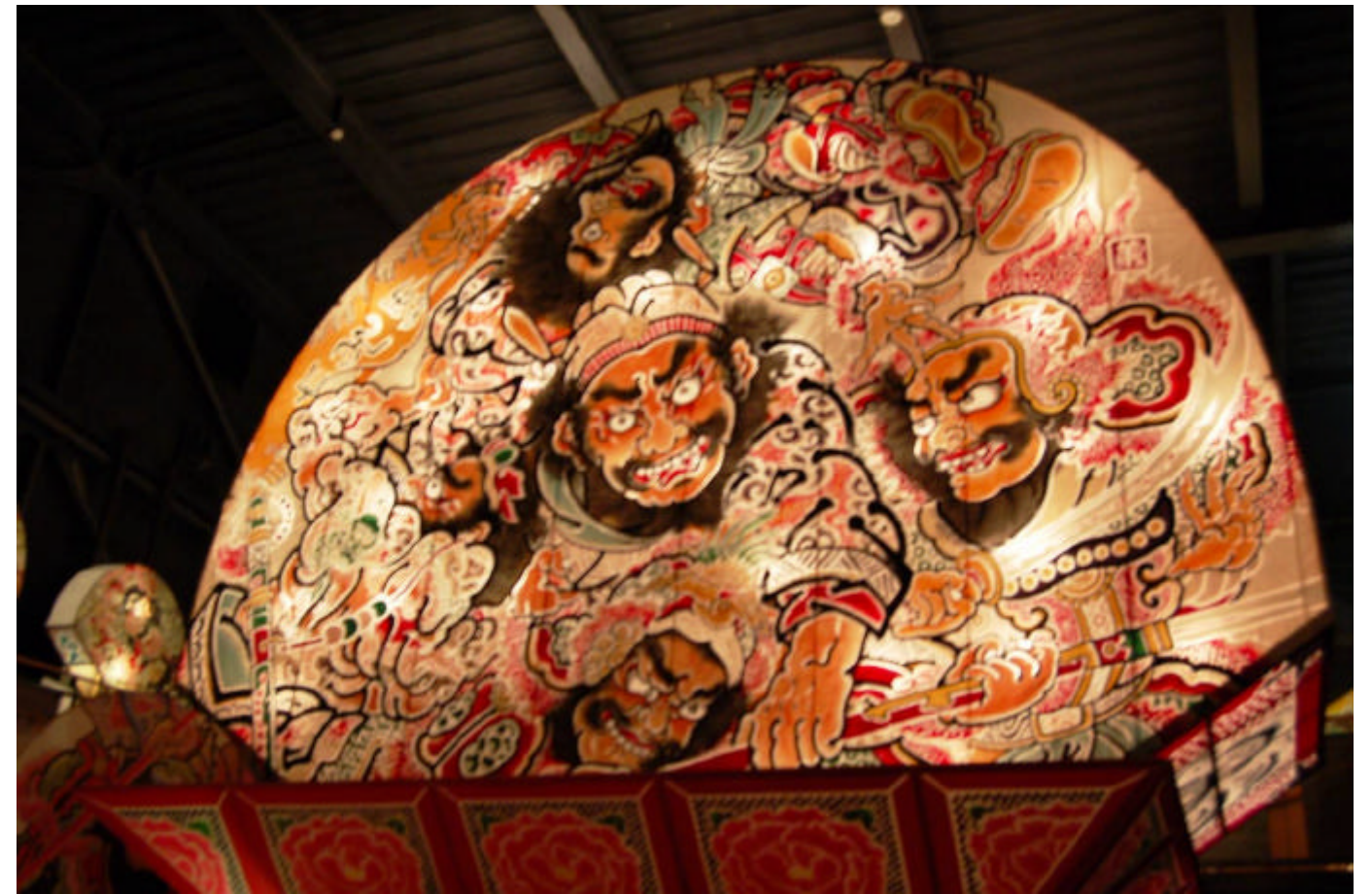
ねぶた / 津軽藩ねぶた村

日時 平成17年10月21日(金) 場所 青森県 弘前市 式典会場 弘前文化センター 祝賀会場 ホテルニューキャッスル